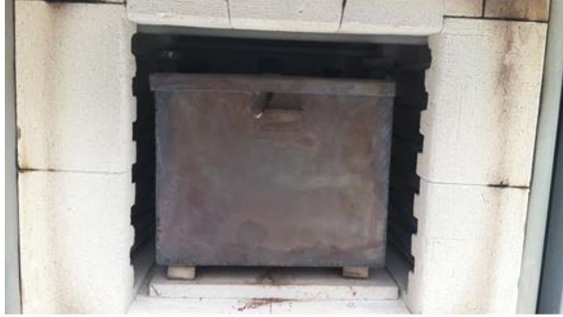
Resim 1. Biyokömür üretimi için özel imal edilmiş kabın kül fırını içerisindeki görüntüsü

Deneme tesadüf parselleri deneme desenine göre her tekerrürde 5 bitki olmak üzere 4 tekerrürlü olarak hazırlanmıştır. 2 lt'lik saksılar içerisinde birer adet bitki kullanılarak hazırlanan çalışma Gaziosmanpaşa Üniversitesi Tarımsal Uygulama ve Araştırma Merkezine ait serada yürütülmüştür. Su ihtiyaçları oldukça bitkiler düzenli olarak sulanmıştır. Saksı karışımlarında 1/1 oranında toprak/turba karışımı olduğu için, turbadaki besin miktarının yeterli olacağı düşünülerek ilave gübreleme yapılmamıştır. Deneme başlatıldıktan 3 ay sonra havanında soğumasıyla beraber gerekli ölçümler yapılarak deneme sona erdirilmiştir. Elde edilen sonuçlar varyans analizi ile analiz edildikten sonra uygulama ortalamaları Duncan çoklu karşılaştırma testi ile karşılaştırılmıştır. İstatistik analizler SAS paket programı kullanılarak yapılmıştır.